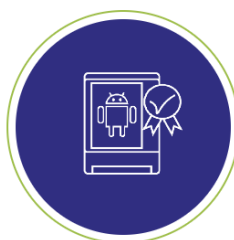
ANDROID & NON-ANDROID