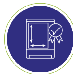
EVA STANDAARD AFMETINGEN