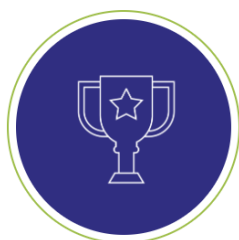
ALLES-IN-ÉÉN & ALLEEN CONTACTLOOS

U kiest zelf waar u uw transactieverwerkingscontract af wilt sluiten. Wij kunnen dit ook voor u regelen door gebruik te maken van het scherpe aanbod van één van de door ons geselecteerde transactieverwerkers.