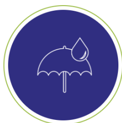
RESISTENT (IK09/IP65) & VEILIG (PCI PTS v6.x)